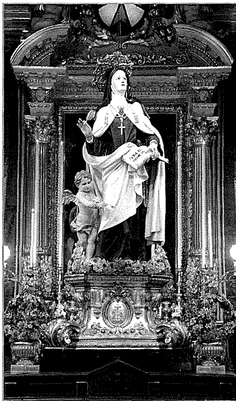
Santa Tereża saret Duttur tal-Knisja 50 sena ilu

*Trasverbazzjoni tfisser tinfid tal-qalb bħala indikazzjoni ta' għaqda intima għall-aħħar fl-imħabba ma' Alla, xi ħaġa li l-Qaddisa Tereżjana tibqa' magħrufa għaliha fi hdan il-mistiċiżmu Kristjan.