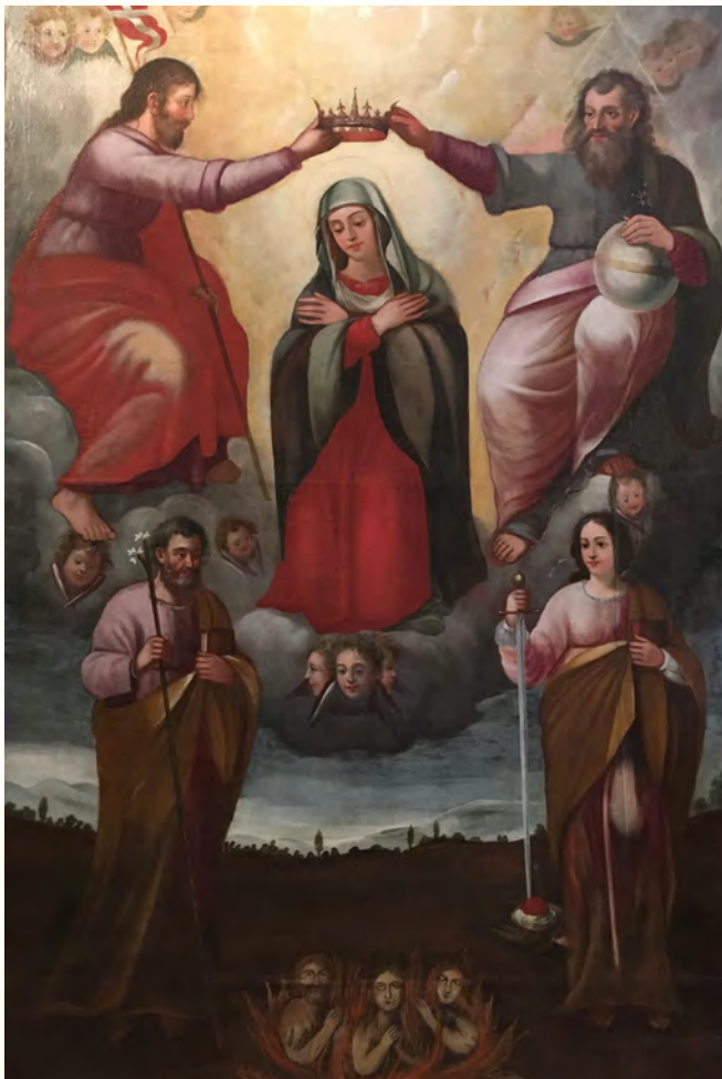
Il-pittura tal-Assunta mal-qaddisin li tisemma għall-ewwel darba fl-1654

Mill-aħħar viżta tas-seklu 17, li saret nhar 28 ta' Ġunju 1699 meta l-knisja l-ġdida kienet lesta u l-antika kienet twaqqgħet, insibu l-konferma li l-pittura tar-Rużarju, bil-kwadretti tal-misteri, li l-viżitatur ra imdendla fuq l-altar, kienet il-ġdida. Fil-fatt, il-viżitatur jagħti wkoll deskrizzjoni tal-kwadru: kien juri lill-Madonna bil-Bambin fil-parti ta' fuq, u fil-parti t'isfel kienu jidhru r-Re David, San Duminku, Santa Katarina ta' Siena u Santa Rosa ta' Lima, waqt li madwarhom kien hemm il-misteri tar-Rużarju. 27 La l-knisja kienet