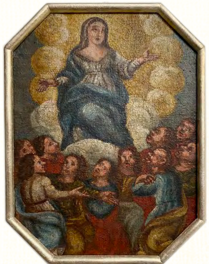
Il-kwadrett tal-Assunta li seta' kien fil-kwadru tar-Rużarju li jisemma fl-1615