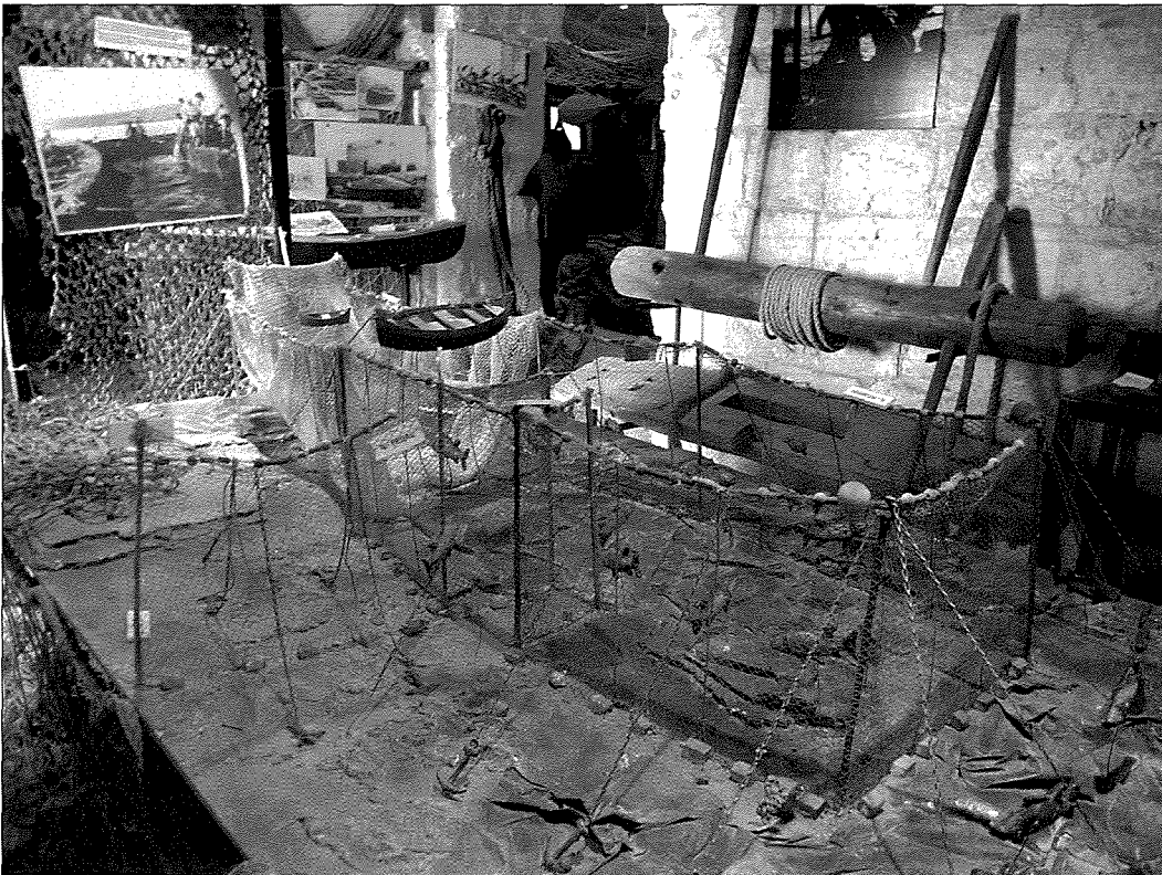
It-tunnara fil-Mużew tat-Tunnara fil-Mellieħa

Fl-1748, il-Granmastru Pinto introduċa x-xibka għat-tonn magħrufa bħala tunnara biex taqbad tonn tal-pinen blu. Din il-ħuta tiġi mill-oċean Atlantiku u tpassi għall-baħar Mediterran mill-Istrett ta' Ġibiltà