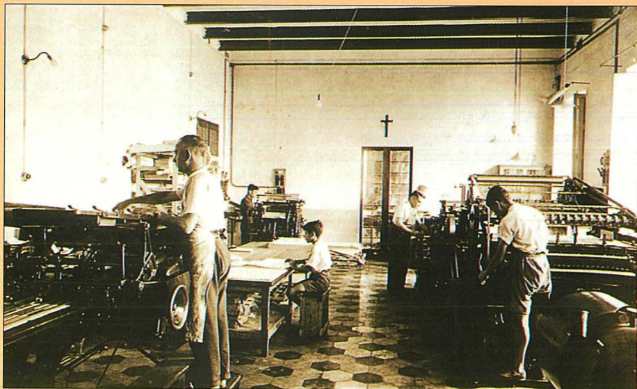
L-Istamperija ta' "Dar San Ġużepp."

"Id-Dar ta' S. Giusepp hi fuq kolloxx dar miftuha ghat-tfal tal-foqra, li l-edukazzjoni tagħhom kif ukoll il-hena ta' din id-dinja jinsabu f'perili serji. Mad-Dar jinsab Laboratorju fejn it-tfal żghar filwaqt il jitghallmu sengha jlestu ruħhom għal li ġej u b'hekk jehilsu lill-pajjiż minn piż, minn xi tebgħa u minn xi periklu. F'din id-Dar hemm ukoll l-iskola elementari bi programm kif jeħtieġ għal nies tas-snaġja. Din id-Dar hi iżjed minn Orfanatrofju għax mhux biss tilqa' tfal iłtiema iżda ukoll tilqa' dawk it-tfal, imsejkna daqs l-łtiema, li għandhom ġenituri, iva, imma li dawn il-ġenituri jew ma jstgħux, jew ma jafux, jew ma jridux irabbu 'l uliedhom ta' nsara. Id-dar ta' S. Giusepp hi fl-aħħarnett ukoll id-Dar ta' dawk it-tfal li mhux rarament issib li aħjar kienu ltiema,