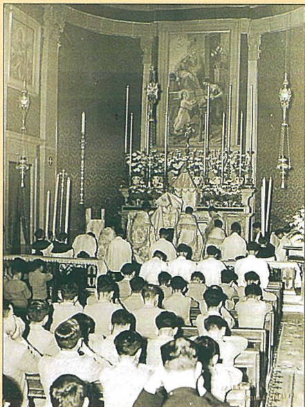
It-tfal ta'din id-dar waqt il-Barka Sagramentali