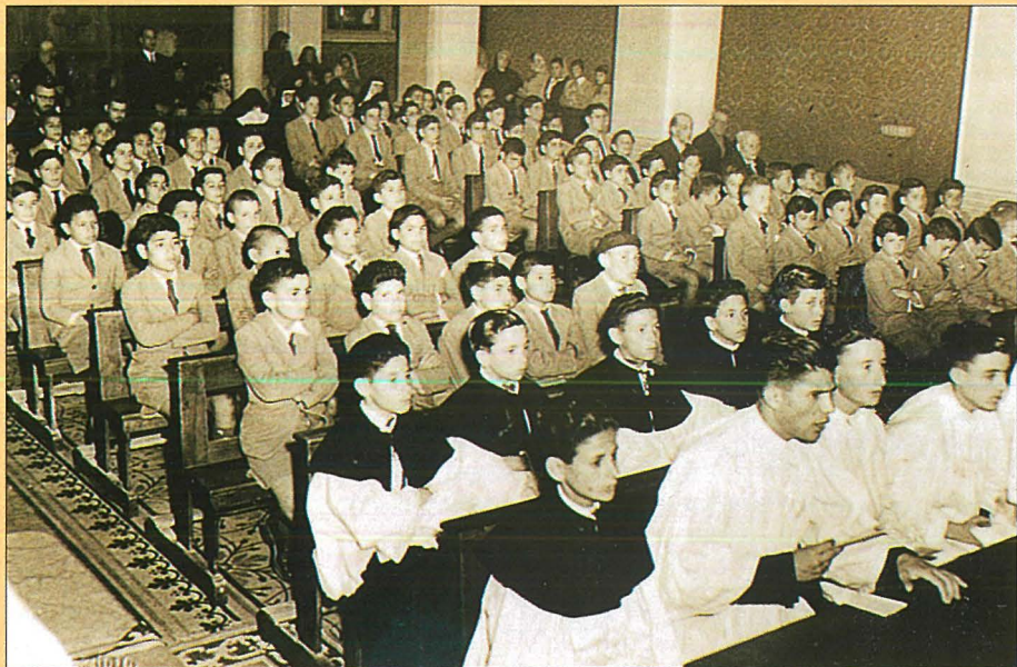
It-tfal ta' din id-dar fil-kappella

mibni tajjeb, b'mohh wiesgħa, xagħar twil u iswed, għajnejh żgħar u penertranti.