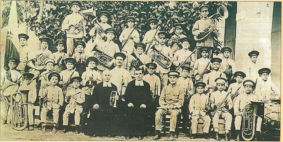
Il-Banda ta' San Ġużepp li daqqet l-ewwel darba 10 ta' Frar. 1900

qalb tat-tifel trid iż-żeghil u l-imhabba ta' l-omm, ma sab lil hadd, u ghalhekk inxtehet ghas-serq u ghal-liberta'. Gbarnieh minn nofs it-triq. Iżda kien wisq tard. Tajnieh l-edukazzjoni li kienet tehtieglu għallinqas biex jista' jghix ta' nisrani u meta wasal iż-żmien li johroġ minn din id-Dar sibnilu post ma' perusni sewwa. Sa ftit taż-żmien ilu sirna nafu li kien qed jaqla' x'jiekol onestament. Kemm kienet tkun ahjar xortieh kieku d-Dar ta' S. Gużepp infetthet qabel.