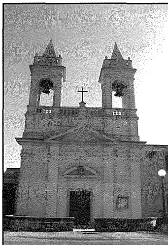
Il-Knisja Madonna tal-Karmnu f’Ta’ Hamet.