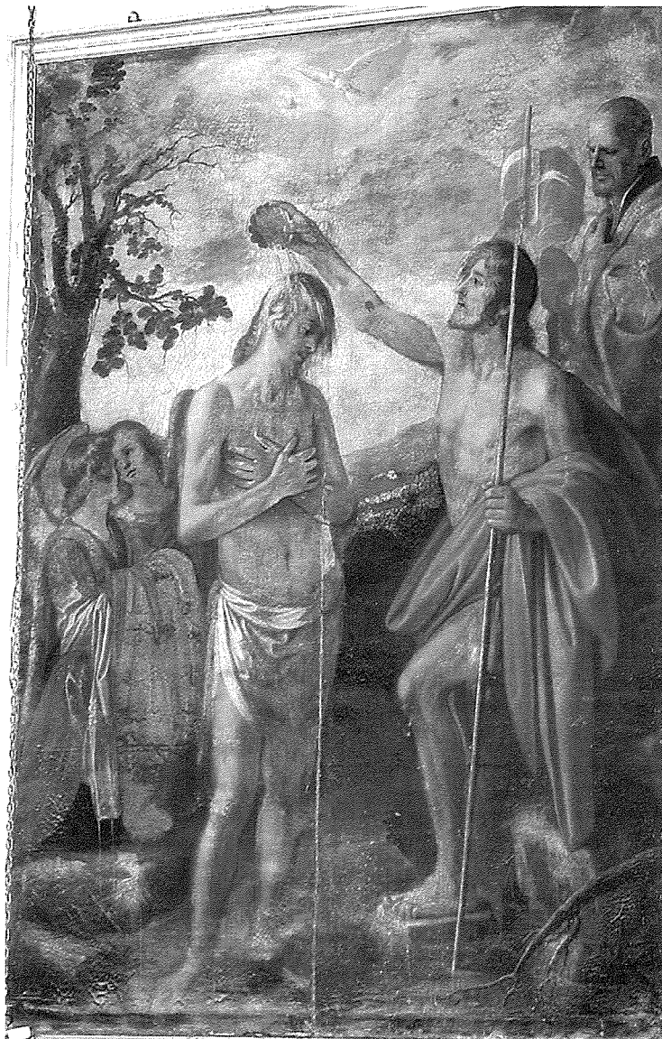
Fig. 1 - Magħmudija ta' Kristu

Din il-pittura tappartieni għaż-żmien meta Minniti kien qed iħalli warajh l-influwenza li kellu minn Caravaggio u beda jinfetaħ għall-kuluri tal-iskola ta' Bologna. Fil-fatt ix-xogħol huwa simili ħafna għar-