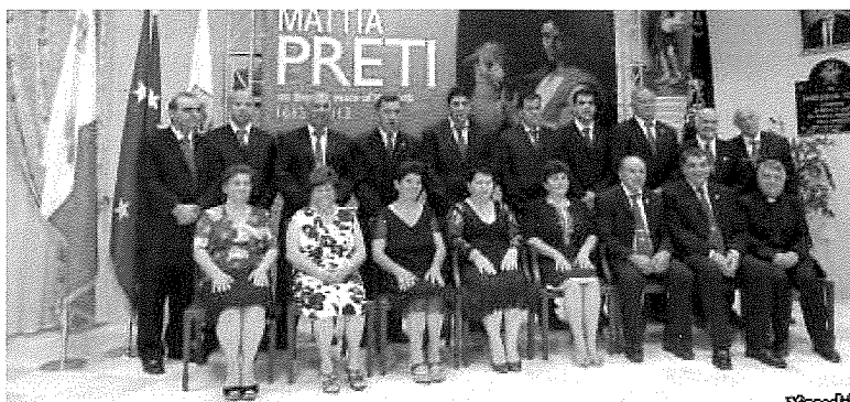
Membri tal-Kumitat fl-okkażjoni tal-ftuħ tal-wirja Gozo Celebrates Mattia Preti .

Non Surrexit Maior , huwa l-isem ta' wirja tal-arti li sejr in intellgħu fil-Każin tal-Banda Prekursur din is-sena, fil-ġimgħa tal-festa. Din is-sena, ser ikollna artisti Xewkin, li ser jesebixxu xogħlijiet tagħhom f' din il-wirja. Il-wirja