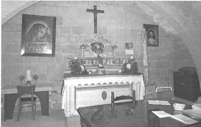
Kappella Azzjoni Kattolika

F'din il-kappella ssir il-festa tal-Madonna tal-Ħniena kif ukoll dik ta' San Bartilmew. Jigi ċelebrat quddies b'mod regolari u anke sigħat ta' adorazzjoni.