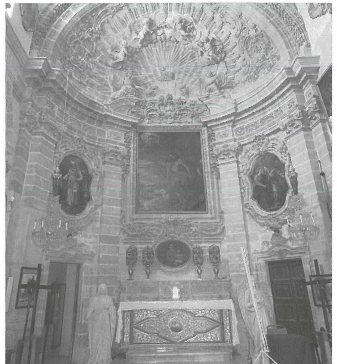
Il-kappella- Mużew tal-Iskultura

Din serviet sabiex fiha jsir il-quddies sakemm tlestiet il-knisja Rotunda. Wara ġieli sar xi quddies ieħor, inżammu laqgħat spiritwali u reliġjużi, saru u għadhom isiru wkoll sigħat ta' adorazzjoni, waqt li kull nhar ta' Hadd għadha ssir l-ispjega tal-Vangelu lit-tfal tal-parroċċa.