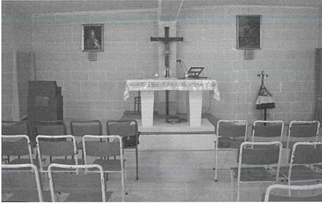
Kappella Ta' Ġokk

Fl-inħawi Ta' Ġokk insibu wkoll kappella żgħira għad-dispożizzjoni ta' dawk li jgħixu f'dawk l-akwati. Din il-kappella hi ddedikata lill-Imqaddes Kurċifiss. Din il-kappella ilha tiffunzjona għal kwazi tletin sena u ssir quddiesa kull nhar ta' Erbgħa waqt li fiha jsiru wkoll xi sigħat ta' adorazzjoni. Qabel ma bdiet tintuża din il-kappella, il-quddiesa kienet issir f'garaxx fil-vicinanzi ta' din il-kappella u bdiet issir fil-bidu tas-snin sebgħin. Ta' min ifakkar li maġenb din il-kappella kien ser jibena Ċentru Pastoral li kien ser jinkludi wkoll kappella ġdida. Fil-fatt, dan ix-xogħol kien beda fis-sena 1995.