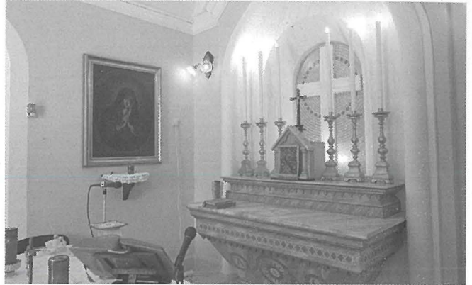
Kappella Ċimiterju Santa Marija

Meta nbena ċ-ċimiterju tal-Belt Victoria, kien jinkorpora fih il-limiti tal-parroċċi tal-Fontana u ta' Kerċem. Sal-lum, ir-residenti ta' dawn iż-żewġ parroċċi, bħal dawk tal-Belt Victoria, għadhom jindifnu f'dan iċ-ċimiterju ddedikat lil Santa Marija. Ma' dan iċ-ċimiterju kienet inbniet ukoll kappella ta' stil gotiku u nbniet mill-Bennej Wigi Vella miż-Żebbuġ Għawdex. Ix-xogħol fuq din il-kappella kien lest f'Lulju 1896.