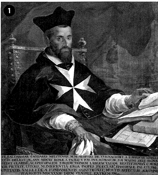
FR. BALTHASAR CAGLIARES MELITENSIS, M.M. ALOPHIO DE VIGNACOURT A SUPPLICIBUS LITELLIS DEUS DELIGHTUR ANN. MDCLV. ROMÆ A PAULO V. P.M. INAUGURATUR. SUI MAGNI ZEITI SIGNA BEDI CLARISSE AC EPISCOPALEM JURISDICTIONEM LABEBAT. TATAM RESTITUTENDA CURAVIT. FIRMITATE LITTERIS MUNIFICENTIA ERGA INOPES. PROCLAM. EPISCOPALE PALATIUM. CRYPTATIS VALLETTÆ A FUNDAMENTIS CONSTRUXIT. MULTIS AFFECTIBUS JERUSAL. IN AUGUSTI MDCCXXIII. DIEM CLAUSIT. EXTREMUM.

Imħeġġeġ minn qaddisu għall-hidma pastorali, l-Isqof Cagliares beda viżta pastorali Għawdex fl-istess sena tal-ħatra tiegħu – ebda isqof qablu u warajh ma għamel viżta Għawdex daqshekk malajr wara l-ħatra. L-Isqof Cagliares beda l-viżta fl-inħawi tax-Xewkija nhar il-Ġimgħa, 20 ta' Novembru 1615.