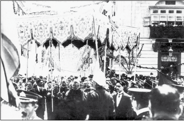
Il-bar 'The Duke of Connaught' fil-pjazza tal-Mosta jidher f'ritratt tal-Kungress Ewkaristiku fl-1913, li wara nfetaħ bhala l-ispizzerija St. Mary's.