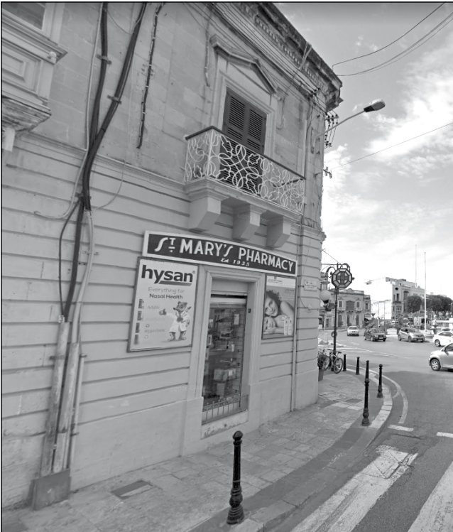
L-ispjżerija St. Mary's fil-pjazza tal-Mosta fl-2018... u kif kienet tidher mill-bieb tal-ġenb fi Triq il-Kungress Ewkaristiku.