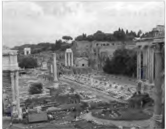
Il-fdalijiet tal-Basilica Ulpia, iddedikata minn Ġulju Ċesri fis-sena 46 qK, u mibnija mill-ġdid minn Djoklezjanu.

l-korsija ewlenija mhux biss tkun usa' min-navi iżda fuq kollox oġġla sabiex kienu jkunu jistgħu jinholqu twieqi apposta minfejn ikun jista' jidħol id-dawl ta' barra.