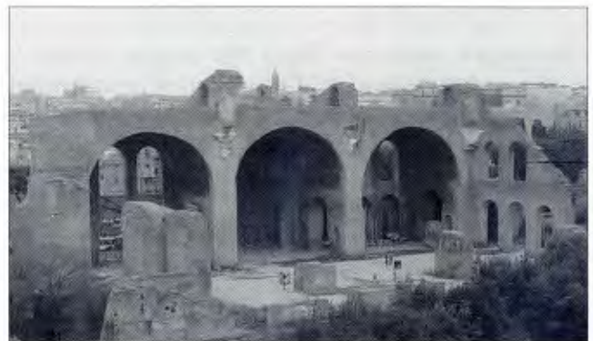
Il-fdalijiet tal-bażilika ta' Massenzju u Kostantinu, tas-seklu erbgha, magħrufa wkoll bħala l-Basilica Nova, l-aħħar u l-ikbar bażilika fil-Forum Ruman.

Żgur illi r-Rumani kienu fost l-akbar promoturi tal-"bażilika" għax barra li f'ħajjithom kellha sinifikat partikulari, il-Belt Eterna kienet saret tabilhaqq iċ-ċentru universali ta' l-iprem u l-ifjen bażiliċi. Bejn is-snin 184 u 121 qabel Kristu kienu diġà ttellgħu ġewwa l-Forum Romanum, jew is-suq ta' Ruma, il-bażiliċi Porcia – l-eqdem waħda li nafu biha sal-lum, Fulvia, Sempronia u Opimia. Wara s-sena 46 qabel Kristu żdiedet magħhom il-bażilika Iulia. Dawn ħadu isimhom mill-fundaturi