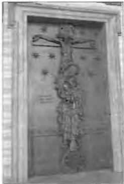
Il-Porta Santa ta' l-arcibażilika ta' San Ġwann Lateran.

Fid-9 ta' Novembru 1989 ġie ffirmat id-digriet Domus ecclesiae li permezz tiegħu ġew imwettqa xi emendi żgħir fil-liġi kanonika li tirregola l-għoti tal-ġieħ tal-bażilika. Il-passi l-kbar f'dan il-kamp kienu diġà saru fl-1968 bis-saħħa ta' dokument ieħor li jġib l-isem ta' Domus Dei . Il-ħsieb dakinhar kien li l-"bażilika" tiġi aġġornata skond l-aħħar riformi liturġiċi tal-Konċilju Vatikan II halli tkun tista' tabilhaqq titqies bħala centru speċjali ta' ħidma pastorali u servizz liturġiku li tagħti xhieda qawwija tar-rabta tagħha mas-Santa Sede u l-Qdusija Tiegħu l-Papa. Fit-tieni każ, jiġifieri fl-1989, ġew indirizzati b'mod estensiv il-formulazzjoni tat-talba formali għall-għoti tat-titlu ta' bażilika minuri, u d-drittijiet u l-obbligi marbuta ma' tali konċessjoni.