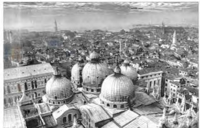
Dehra minn fuq tal-bażilika patrijarkali ta' San Mark, Venezja.

Waħda mill-karatteristiċi li jpoġġu lil dawn il-knejjes ewlenin fi klassi għalhom hija l-famuża Porta Santa . Kull waħda minnhom għandha "l-bieb imqaddes" tagħha li jinfetħ kemm-il darba tiġi mfakkra s-Sena Mqaddsa. Miegħu hemm marbut ukoll ir-rebħ ta' l-indulġenzi plenarji. Sa f'tit tas-snin ilu, flimkien mal-bażilika minuri ta' San Lorenzo fuori le mura, dawn il-bażilici maġġuri kienu jissejġu wkoll "patrijarkali", frott ir-rabta tagħhom mal-hames patrijarkati "tradizzjonali" tal-Knisja, jiġifieri Ruma, Kostantinopli, Lixandra, Antjokja u Ġerusalemm rispettivament. Izda mindu l-Papa prezenti, Benedittu XVI, għażel li ma jibqax iġib it-titlu ta' "Patrijarka tal-Punent" dawn il-knejjes bdew jiġu identifikati minflok bħala bażilici "papali".