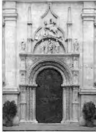
Il-bieb ewlieni tal-bażilika ta' San Nikola, Tolentino, li fuqu tidher ix-xbieha ta' San Ġorġ.

knisja "Kostantinjana" ta' l-Appostli, jagħmel għall-ewwel darba osservazzjoni fuq ix-xebh tagħha mas-Salib imqaddes. Minhabba li f'dawk iż-żminijiet il-qima lejn is-Salib kienet qed tinfirex ġmielha, il-forom arkitettoniċi Rumani li kienu prevalenti fil-qasam tal-bini pubbliku bdew jiġu meqjusa minn perspettiva differenti għax magħhom issa kien beda jkun assoċjat simbolizmu qawwi li kellu rilevanza sinifikanti għall-Kristjani.