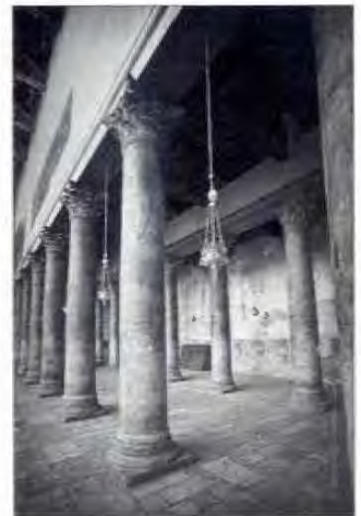
Il-bażilika tan-Natività, Betlehem.

L-ewwel bażilici Kristjani li kellhom il-kappelluni laterali ġew mibnija b’ordni ta’ l-imperatur Kostantinu, kemm f’Ruma u kemm f’Kostantinopli. Filfatt San Ġirgor Nazjanenu (329 c. 390), waqt li jfisser il-