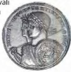
Ix-xbieha ta’ Kostantinu fuq munita ta’ żmien.

Ġrajjet il-“bażilika”, madankollu, ma tiqafx mar-Rumani. Huwa minnu li fi żmienhom, bis-saħħa ta’ programm ta’ espansjoni, il-“bażilika” laħqet il-quċċata ta’ l-universalità tagħha. Biss kellha tkun il-Knisja ta’ Kristu Ġesù li tagħmel minnha storja ta’ ġieħ li ma tafx tmiem.