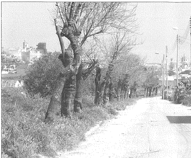
It-triq ta' Qasam San Ġorġ il-lum, li taqşam bir-raba' r-Rabat mill-irħajjel ta' Santa Luċija.

Ċ-ċentru storiku tar-Rabat u tal-komunità Kristjana ta' Għawdex sa minn żminijiet bikrija jgħib l-isem ta' San Ġorġ. M'huwiex magħruf meta dahal għall-ewwel darba l-kult lejn San Ġorġ fil-gżira Għawdxija imma huwa diffiċli timmagina li l-Bizantini daħlu f'Għawdex biex joqoqħdu mingħajr ma daħħlu ismu magħhom. L-ewwel dokument uffċjali li jsemmi lil San Ġorġ tar-Rabat huwa dak tal-Ġublew tal-papa Nikola V tas-sena 1450 li jsemmi lil San Ġorġ fost il-knejjes li gawdew mill-indulgenzi. Mela kif qed naraw, "San Ġorġ" m'huwiex biss riferenza għall-qaddis martri imma wkoll għall-ħāra li fiha tinsab il-knisja lilu ddedikata. L-espressjoni "Fejn San Ġorġ", li hija magħrufa l-iktar mill-parruċċani ta' din il-knisja imma wkoll min-nies tar-Rabat b'mod ġeneralni, tinkorpora fiha l-pjazza, il-knisja u l-toroq li jwasslu għaliha, jiġifieri Triq Karitā