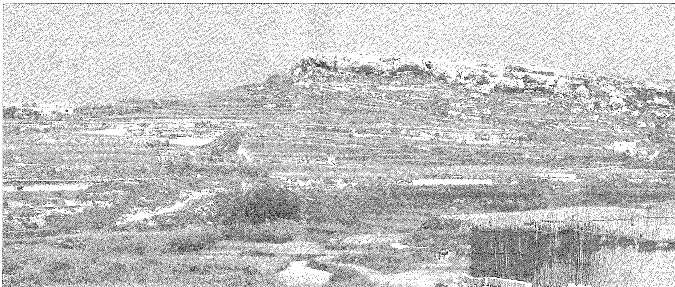
Dehra mill-bogħod tal-Mixta u Ras il-Wardija.

It-tielet lokalità f'Għawdex li ggħib isem San Ġorġ hija n-naħa magħrufa bħala "ta' Qasam San Ġorġ". Din il-ħāra hija fil-fatt parallela ma' San Ġorġ tal-Ħaġar u bħal donnu trid turi li kif hemm il-parti urbana li ggħib isem il-qaddis ta' Lidda, hekk ukoll hemm il-parti rurali parallela magħha. Wieħed isib triqta lejn Qasam San Ġorġ jekk mir-Rabat iħalli l-post imsejjaħ "wara ta' Gedrin" u jerħilha lejn ir-raħal ta' Ta' Kerċem imma jzomm mat-triq ta' fuq il-lemin tar-raħal bħal qisu sejjer lejn Santa Luċija. Bl-Ingliż din In-naħa hllja magħrufa bħala St George's Fief . John Bezzina jsemmi dan f'artiklu minn tiegħu: