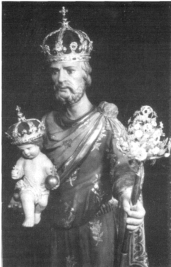
San Ġuzepp ix-Xiħ, l-Istatwa antlka ta' San Ġuzepp miżmuma bl-ikbar għożża u devozzjoni fis-santwarju tar-Rabat ta' Malta. Din hija xogħol fl-injam tas-seklu sittax u għet Inkurunata fl-1 ta' Mejju 1963, b'digriet tal-papa Piju XII li jgħib id-data tas-27 ta' Lulju 1956

L-eqdem fratellanza ta' San Ġuzepp hija bla dubju dik tar-Rabat ta' Malta, magħrufa bħala l-Arċikonfraternità ta' San Ġuzepp. Sa mit-twaqqif tal-knisja ta' Santa Marija ta' Ġesù tal-patrijiet Franġiskani Minuri fir-Rabat, insibuha digà tiffunzjona f'dan il-maqdes ta' dawn il-patrijiet li kellhom devozzjoni lejn dan il-qaddis. Tant hu hekk li dan l-ordni kien ilu għal żmien twil, sewwa sew sa mill-1399, jiċcelebra