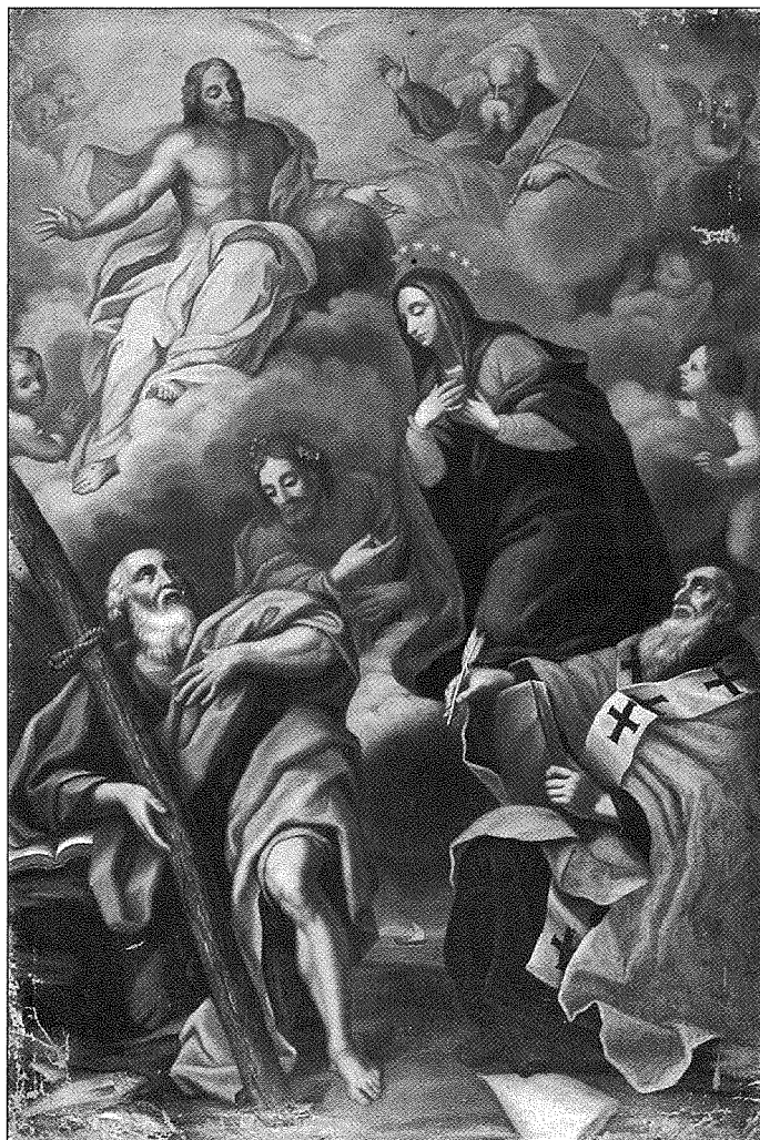
L-inkwadru l-antik tat-Trinità Qaddisa li kien flok dak ta' San Ġużepp; il-pittur m'hux magħruf.

It-tieni altar fuq in-naħa ta' l-Epistola huwa ddedikat lil San Ġużepp. Mill-1674 sa l-1739 dan l-altar kien iddedikat lil Sant'Omobono. Il-kwadru l-antik li kien sar fl-1674 m'hux magħruf fejn spicċa. Il-festa ta' dan il-qaddis kienet issir fit-13 ta' Novembru u huwa l-patron tal-hajjata. 3 Wara l-1739 l-altar ta' Sant'Omobono gie ddedikat lit-Trinità Qaddisa u dan għaliex fl-istess sena kienet giet imwaqqfa fih ix-Xirka tat-Trinitari mill-prokuratur ġenerali Fra Mikiel ta' San Rafel. 4 Il-hsieb tat-twaqqif ta' din il-fratellanza kien li tigbor flus biex bihom tifdi l-ilsiera, għalhekk kienet magħrufa wkoll bħala "tal-fidwa". Din ix-xirka giet miżmuma fi zmien il-Franċiżi fl-1798. 5 Wiehed