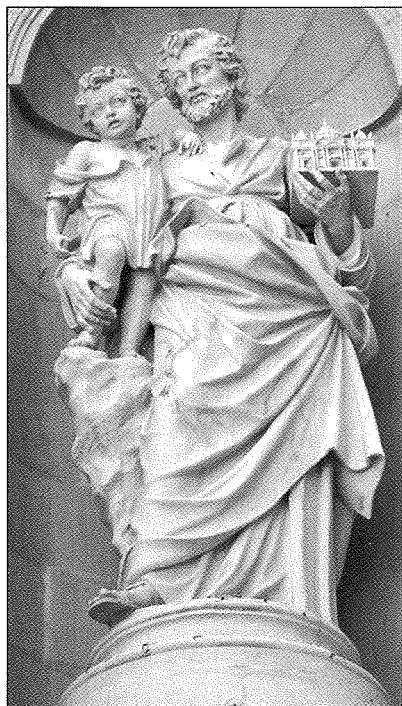
L-istatwa ta' San Ġużepp li tinsab fil-lemin tal-faċċata tal-knisja