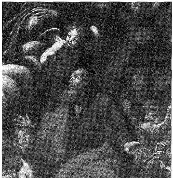
Il-kwadru ta' l-Apoteozi ta' San Pawl fil-parroċċa ta' San Pawl Barra s-Swar.