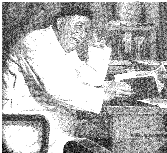
Kwadru tal-pittur Gian Battista Conti li jnsab fis-Sala Mons. Lmanuel Mercieca

Jekk minn fuq il-kwadru ta' San Pawl tal-Palombi ħarstek timrah 'il fuq f'linja vertikali, għajnejk bilfors jaqgħu fuq xbieha ohra ta' San Pawl, fejn jidher ma' l-ewwel daqqa t'għajn li l-artist baqa' fidil lejn il-kuluri u l-karatteristiċi ta' Palombi. Qed nitkellem fuq ix-xbieha ta' San Pawl fl-arzella ta' l-abside tal-kor tal-bażilika ta' San Ġorg.