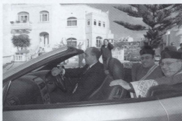
Dun Tonio jasal fil-parroċċa tal-Munxar akkumpanjat mill-Arcipriet

kont fost l-udjenza, nirrapprezenta lill-Kunsill Parrokkjali. Għajnejja ta' spiss marru fuq il-pittura (Caruana Dingli) ta' San Ġorġ bhala patron fil-ġenb tat-titular!