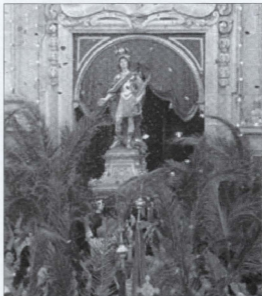
It-tixir tal-palm waqt li l-banda La Stella tesegwixxi l-Inno a San Giorgio Martire. 16.07.2006 - 07.05pm

Il-proġett li nbeda sitt snin ilu issa diehel fl-aħħar fażi tiegħu. Fadal ħafna xi jsir fih! U kemm! U, bħallikieku m'hux biżżejjed, kellna nidhlu wkoll għall-proġett kbir u urġenti tal-bidla ta' l-istallazzjoni tad-dawl (li ġejna mwissija li kienet saret perikoluża) u magħha (bilfors ladarba se jsir xogħol ta' titqib, eċċ) tar-restawr ta' l-irham.