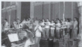
Il-grupp 23four youth band and choir janima ċ-ċelebrazzjoni. 11.07.2006 - 10.30pm