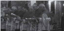
Parti mill-kapitlu tal-kollegġjata jiehu sehem waqt l-kant ta' l-Għasar. 13.07.2006 - 06.50pm

Ma nkunux sejrin żmerċ jekk napplikaw din il-frazi għall-mużika li tiġi esegwita fil-bażilika ċittadina ta' San Ġorġ martri, fl-okkazzjoni tas-solenità tal-patron tal-belt Victoria u protettur ta' l-Għawdxin. Għaliex tassew din hi l-verità, kif magħrufa u