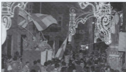
Briju miż-żgħażaġh Ġorġjani fit-Triq ir-Repubblika. 14.07.2006 - 11.30pm