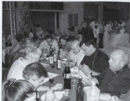
Ikla tal-festa fi pjazza San Ġorġ. 10.07.2006 - 09.20pm

L-Istatwa ta' San Ġorġ Żagħżuġh, li hi ċ-ċentru tad-dimostrazzjoni tal-Famnis, ġiet akkumpanjata