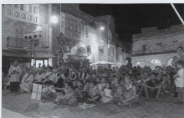
Mijiet ta' zghazagh Ġorġjani u Għawdxin jattendu għall-laqgħa organizzata mill-grupp 23four, għall-ewwel darba fi pjażza San Ġorġ. 11.07.2006 - 10.05pm