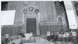
Pjazza San Ġorġ waqt iċ-ċelebrazzjoni. 11.07.2006 - 10.00pm