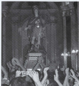
Il-hruġ trijonfali ta' l-istatwa ta' San Ġorġ min-niċċa fast iċ-ċapċip tan-nies preżenti. 11.07.2006 – 09.15pm

Din forsi tidher dahla twila għal dak li rrid nitkellem fuqu hawn, imma tajjeb li wiehed jifhem sew is-sens tal-kelma liturġija fil-Knisja Kattolika, wisq drabi mtappna mill-pjetà popolari u mħallta mal-kultura lokali b'tali mod li dan safa ta' dannu għar-rikkezza tal-liturġija fiha nfisha, ġeġja frott sekli shaħ ta' Tradizzjoni fi hdan il-Knisja. Qed ngħid dan ukoll għax hekk wiehed jista' jifhem aħjar l-aspett liturġiku fil-hajja tal-komunità parrokkjali tagħna. Kemm-il