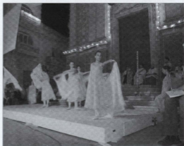
Mumenti ta' žfin fuq palk armat għall-okkażjoni. 11.07.2006 - 10.20pm