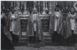
Il-kant ta' l-Għasar mill-kapitlu u l-kleru tal-kollegġjata waqt il-jiem tat-tridu. 12.07.2006 – 07.15pm

Ta' kull sena jkollna kummenti sbieħ hafna fuq il-liturġija fil-jiem tal-festa, li nistgħu ngħidu li hi wiehed mill-mumentanti prinċipali fil-kalendarju festiv. It-tieni ġimgha ta' Lulju tara l-bażilika ta' San Ġorġ miżgħuda b'Maltin, Għawdxin u wkoll barranin li jiġu apposta biex jieħdu sehem fil-liturġija li tiġi ċċelebrata mill-komunità flimkien mal-kapitlu Ġorġjan, bl-appuntamenti l-aktar importanti jkunu t-tliet funzjonijiet tat-Tridu solenni, it-translazzjoni pontifikali bl-Għasar tal-vġili tas-solennità ta' San Ġorġ, il-pontifikal solenni mmexxi mill-isqof djoċesjan nhar il-festa filgħodu, u l-purċissjoni pontifikali filgħaxija. Flimkien ma' dawn, imbagħad, il-jiem bejn it-Tlieta u l-Ħadd ikunu sensiela ma taqta' xejn ta' ċelebrazzjonijiet fil-knisja u barra. Għid 'barra' wkoll, għax ikollna okkażjonijiet speċjali meta nagħmlu xi ċelebrazzjoni barra mill-hitan tal-knisja, bħalma