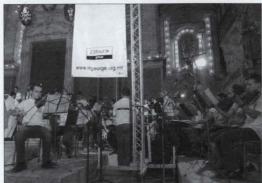
Il-grupp imdaqqs tat-23four youth band & choir li ha hsieb li janima din il-laqgħa bit-tema “ Bil-qawwa ta’ l-Ispirtu s-Santu, jien dak li jien ”. 11.07.2006 – 10.40pm

Definittivament kienet fuq kollox is-sistemazzjoni ġenerali ta’ pjazza San Ġorġ li tat id-dehra professjonali