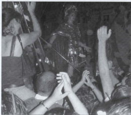
L-Istatwa ta' San Ġorġ ta' barra, l-ewwel statwa għall-festi esterni f'Għawdex, ittella' fuq il-pedestal fost iċ-ċapċip u l-entuzjażmu tan-nies preżenti. 14.07.2006 - 00.50am