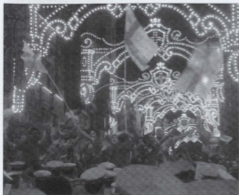
Foal kbar ta' partitarji Ġorġjani jifirfu mad-daqq tal-marċ tal-banda ċittadina La Stella fi Triq ir-Repubblika. 14.07.2006 - 11.10pm

Il-festi esterni ntemmu bil-marċ ta' l-aħħar li beda minn quddiem id-dar tas-Socjetà għall-quddiem il-bażilika Ġorġjana. Meta l-marċ wasal pjazza San Ġorġ, il-banda nghaqdet mal-parruċċani preżenti u tat 'kunċert' spontanju u divertenti li mbagħad ingħalaq bl-innu popolari Lill-Kbir Martri San Ġorġ.