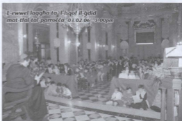
L-ewwel laqgħa ta' l-isqof il-gdid mat-tfal tal-parroċċa. 03.02.06 - 5:00pm