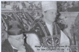
Waqt il-pontifikal solenni fil-bażilika ta' San Ġorġ 05.02.06 - 11.00am