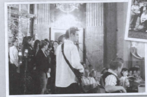
L-ewwel min sensjela ta' quddies taż- zghażaġh ghaż-zghażaġh organizzata mill-grupp 23four kull l-ewwel Hadd taħ- xahar – 02.10.2005