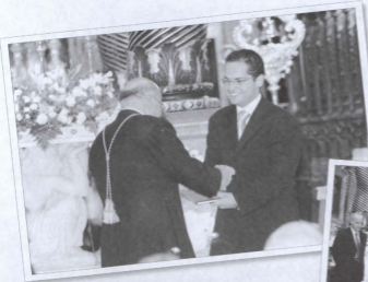
Prezentazzjoni ta' l-Enciklopedija bilingwali ta' San Gorg