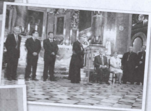
Zjara uffiċjali tal-President ta' Malta, Dr. Edward Fenech Adami – 23.10.2005