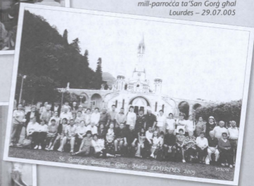
St. George's Basilica - Gozo - Malta - EMPRESSES 2005