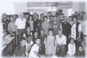
Il-Grupp kollu li mar Ruma

Dawn kienu ġranet li ma ninsawhom qatt u ma joghruq qatt la minn mohħna u lanqas minn qalbna.