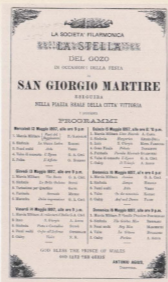
Programm tal-Festi ta' San Ġorġ ta' l-1897 li juri l-programmi mużikali tal-Banda La Stella. F'dak l-2-zmien il-festi kienu jsiru f'Mejju.

Storz l-imhabba u l-entuzjażmu tad-direnti tas-Socjeta', minn sena għal oħra dejjem rajna din il-festa tibker sa ma illum nistgħu ngħidu li sareh wahda mill-isbah u l-aktar festi solenni li jzejnu l-istagun tal-festi parokkjali