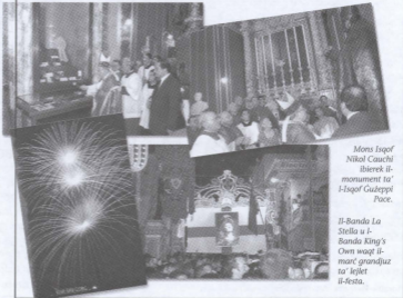
Mons Isqof Nikol Cauchi ibierek il-monument ta' l-Isqof Galeppi Pace.

Zgur li mal-festa ma jieqafx kollox. Tkompli l-hidma f'kull qasam, kemm fil-parroċċa kif ukoll fi hdan is-Socjeta' La Stella. Ahna konvinti li kull Ġorġjan ser jibqa' jaġhti s-sehem tiegħu. Dan huwa meħtieġ u għalhekk huwa importanti li niehdu sehem attiv f'dak kollu li torganizza l-parroċċa taghna minn żmien għal żmien. Ix-xitwa li ġeja zgur li mhux ser tmewwet l-impenn ta' kulhadd biex koll hidma tibqa' għaddejja.