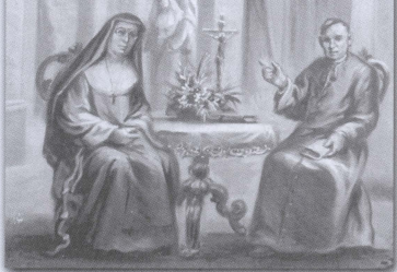
Madre Margerita mal-Fundatur Dun Gużep Diacono fil-loġġa tal-'Casa Madre'

(Mill-'Fujett 'Paci u Gid' – Jannar 2002)