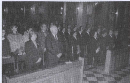
Parti mill-kongregazzjoni waqt iċ-ċelebrazzjoni Solenni