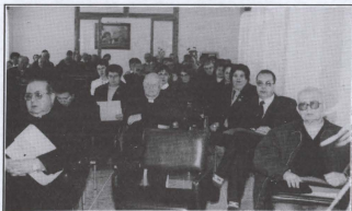
Uhud minn dawk li attendew għas-Seminar. Fuq ix-xellug jidher Mons Isqof.

Dawn il-punti ngabru fis-sezzjoni finali fil-preżenza ta' Mons Isqof Nikol Cauchi li ta wkoll il-messaġġ tiegħu u fahhar dawn l-inizjattivi tant bżonnju. L-Arcipriet Mons Guzeppi Farrugia kkonkluda l-okkazzjoni billi rringrazzja lil dawk li għenu fl-organizzazzjoni u lin-numru sabih minn firxa wiesgħa ta' kategoriji li hadu sehem tant attivament. Huwa wiegħed li dan il-materjal ser jiġi studjat mill-iktar fis-biex jibda jithaddem fil-qafas ta' pjan shih, anke b' follow-ups.