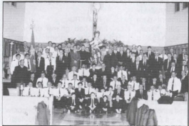
Ritratt tifkira tal-Grupp kollu fuq il-Presbiterju ta' St. Paul's hekk kif intemmet il-Konċelebrazzjoni