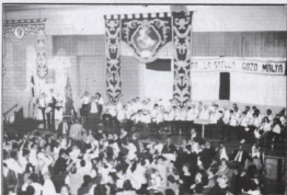
Festa Gorgjana waqt Dinner Dance fil-Lithuanian Hall, bis-sehem tal-Banda La Stella

Il-mawra tal-Banda La Stella fil-Kanada, kienet sponzorjata mill-Mid-Med Bank.