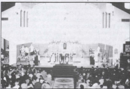
Mons. Arċip. Salv Borg imexxi Konċelebrazzjoni f'St. Paul's Church.

Minn hawnhekk l-istatwa nġarret proċessjonalment sal-Knisja ta' San Pawl, akkumpanjata mid-daqq tal-Banda La Stella. Ta' min igħid li din kienet l-ewwel darba li saret purċissjoni bl-istatwa ta' San Ġorġ f'Toronto.