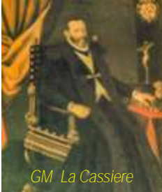
GM La Cassiere

Kien magħruf għall-għerf u l-għaqal tiegħu. Fl-1572 insibuh Vigarju tal-Kardinal Carafa, l-Isqof ta' Napoli, imma kellu jitlaq minn hemm f'Marzu 1573 wara li daħal f'biċċa nkwiet. Mar Ruma u wara sena u tliet xhur intbagħat Malta. Wasal nhar il-Ħadd t'Awwissu 1574.