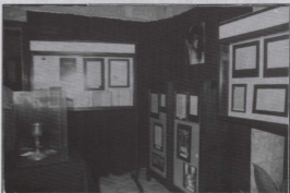
Parti mill-esebiti fil-Wirja fil-Banca Giuratale