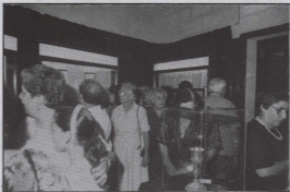
Mijet ta' nies iżuru l-Wirja.