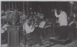
Waqt il-Kunċert ta' Mużika ta' Mgr. Farrugia fil-Bażilika