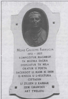
Il-Lapida li tfakkar lil Mons Giuseppe Farrugia fi Pjazza San Ġorġ

Dan is-saċerdot li kien kwazi ntesa mill-poplu kien jisthoqqqu verament li jkun mfakkar u jnġhata għieh kif deher mill-kunċert ta' mużika sagra li sar fil-Parroċċa tagħna kif ukoll mill-wirja li għet imtelgħa fil-Banca Giuratale. Kienet verament inizjattiva ta' minn ifahharha u jnkoraġġiha u għalhekk li sabet l-għajjuna tal-Ministeru għal Ghawdex kif ukoll il-patronaġġ tas-Segretarjat tal-Kultura u tal-Kunsill tal-Kultura t'Ghawdex. Għalhekk deher ilna li huwa xieraq li nfakkr u b'suppliment dawk l-attivitatiet li saru biex jibqa' imfakkar Mons Giuseppe Farrugia: il-Kunċert ta' Mużika Sagra, li kien l-ewwel attivita' tal-Maltafest '91 f'Ghawdex; il-kxiif u tberik ta' lapida fi Pjazza San Ġorġ, b'bust tal-bronż maħdum lill-artista l-Kav. Alfred Camilleri Cauchi; u l-wirja dwar haġtu u hidmietu li saret fil-Banca Giuratale.