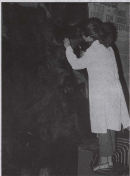
Wahda mir-restawraturi waqt il-fażi preleminari tar-restawr.

Biex isir dan ix-xogħol hija meħtieġa somma mhux hażin ta' flus. Ġa nġabru fondi permezz tal-wirja u biegh ta' pitturi ta' Giorgio Rocca u anke minn diversi donazzjonijiet li għamlu xi whud mill-komunita' parrokkjali tagħna. Permezz tar-rivista tagħna nixtiequ nhegġu ohrajn biex jekk jistghu jghinu dan il-proġett ta' fejda li qed isir fil-parroċċa.