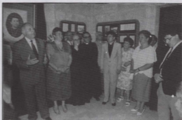
Il-Ministru Tabone jtkellem waqt l-inawgurazzjoni tal-Wirja.