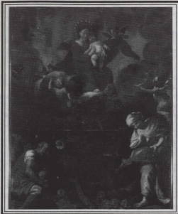
Il-Kwadru ta' I-Erwieh

esibizzjoni huwa prinċipalment li dawn il-kwadri jinbiegħu u l-qliegħ mianhom imur għall-fond tar-restaw. F'din il-wirja ser ikun hemm ukoll għall-bejgħ