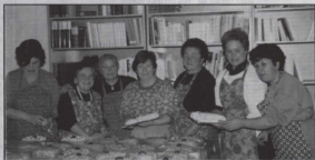
Xi whud mill-"Ladies" waqt ix-xogħol fuq il-figolli fiċ-Ċentru Parrokkjali