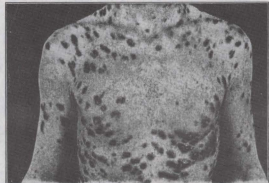
Gisem imtebba' bil-marki ta' l-AIDS

(3) Il-tielet mod kif wieħed jiehu l-Aids hu l-kas ta'