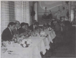
L-uhud mill-mistiedna tas-Socjeta' La Stella waqt l-Ikla.

L-ewwel attivita' soċjali organizzata mis-Soc. Fil. La Stella ghas-sena l-għida kienet ikla mogħtija mid-direzzjoni b'riżq il-membri kollha mseħbin f'din l-Għaqda Mużikali. L-ikla, li tingħata ta' kull sena f'dan iż-żmien bhala rikonoxximent tax-xogħol diżinteressat li jwettqu l-membri matul is-sena, inżammet fil-Penelope Restaurant tal-Hotel Calypso, Marsalforn, nhar il-Hadd 20 ta' Jannar.