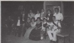
L-atturi tal-Astra Dramatic Company li hadu sehem fil-kummiedja.