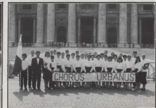
Il-Kor fi pjazza San Pietru f'Ruma