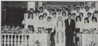
Il-Kor f'San Lorenzo in Damaso

Pero' l-iktar mument mistenni, l-holma u l-ambizzjoni ta' kullhadd, kien meta l-CHORUS URBANUS li ġie mistieden ufficjalment biex ikanta fis-Sala Nervi, ta kuncert ta' kant waqt l-uddjenza Papali. Il-Kor ġie allokat post prominenti fuq quddiem, tefa' ta' ġebla 'l bogħod mill-Papa. Kien l-ewwel kor Malti li kanta l-Innu Ufficjali taż-żjara tal-Papa ġewwa l-Vatikan,