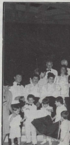
Il-Papa mal-Kor, flimkien ma' l-Ambaxxatur