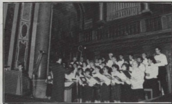
Il-Kor f'San Pietru