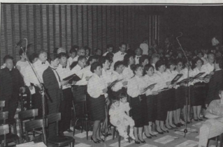
Il-Kor f'Sala Nervi