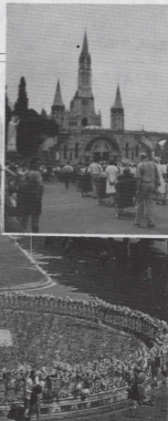
Il-Pjazza ta' quddiem is-Santwarju fejn isiru l-Purcissjonijiet għall-morda u dik ta' bil-lejl.

Go Lourdes ma tixba qatt. Il-ħin għaddi jgri. Il-fidi tmissha b'idejk. It-tama tixgħel il-qalbek. Thosok li trid thobb lil kulhadd: lil min taf u lil min qatt ma rajt. Is-skiet ta' ġol-Grotta, id-dmugh iġelben ma' haddejn il-Pellegrini, l-ilmiġiet li kulhadd jipprova jgħorr lejn daru biex donnu jdewwaq lil niesu dak li jkun daq hu għewwa din il-belt