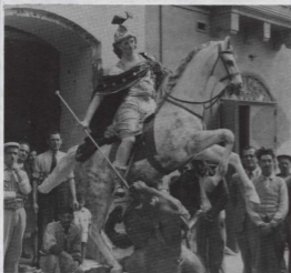
L-Ewwel statwa ta' San Ġorġ fuq iż-Żemel li saret għall-festi esterni tidher quddiem l-imħażen ta' l-Oriġenti fi Triq it-Tiġrija (filum Triq ir-Repubblika). Dan hu wieħed mir-ritratti li akkwistajna wara l-Wirja ta' Ritratti Antiki.

Fl-okkazzjoni tal-Gimgha tal-Parroċca li nzammet bejn il-Hadd 19 ta' Novembru u s-Sibt 25 ta' Novembru 1989 giet organizzata wirja ta' ritratti antiki li għandhom x'jaqsma mal-parroċca tagħna. Dawn ir-ritratti kienu gaw mogħtija minn diversi individwi wara appell li kien sar li ser jitwaqqaf arkivju fotografiku tal-parroċca. Kienu esebiti madwar mitejn ritratt u mijiet ta' nies zaru din il-wirja filwaqt li fahħru din l-inizjattiva. Bħala rizzultat ta' din il-wirja xi persuni oħra wasluna iktar ritratti antiki jew biex jigu mizmuma mill-parroċca jew biex issir kopja tagħhom.