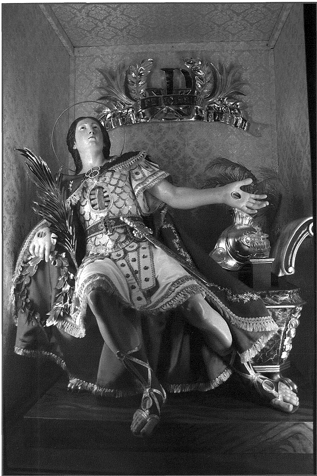
Il-Korp Sant ta' San Feliciġsimu lura fil-glorja kollha tiegħu