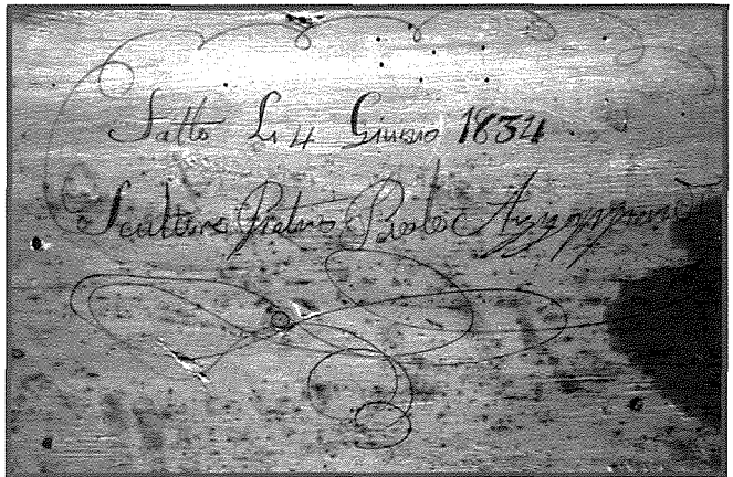
Il-Firma tal-Artist fuq il-Korp Sant ta' San Felicissimu

Kif semmejna, Azzopardi kien meqjus bħala artist mill-aqwa, tant li ħadem bosta xogħlijiet importanti matul il-karriera tiegħu. Fl-1808, meta kien għad kellu biss sbatax-il sena, hu naqqax il-figura ta' Ġesù Redentur għal Hal Għaxaq fil-ġebbla Maltija. Għall-ħabta tal-1822, Azzopardi kompla x-xogħol fuq l-istatwa ta' Santu Rokku tal-Qrendi, li kien beda u ma temmx l-imgħallem tiegħu