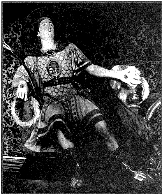
Il-Korp Sant ta' San Felicissimu qabel it-Tieni Gwerra

Intant, dik is-sena saret festa kbira ad unur San Felicissimu kif kien xieraq u minnufih xterrdu l-qima u d-devozzjoni lejn dan il-qaddis. Jingħad li l-Kappillan Sultana, flimkien mar-retturi tal-fratellanzi qablu li ssir urna tal-irħam fuq l-artal