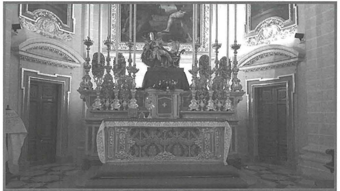
Il-Korp Sant ta' San Feliċissimu Armat għall-Festa Tiegħu fuq l-Artal Maġġur