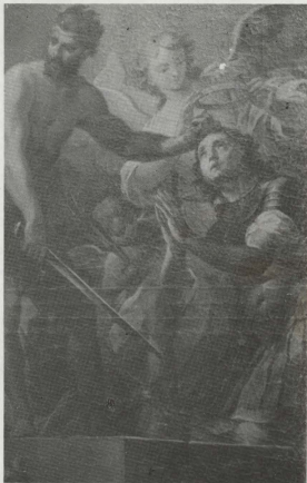
Detall minn wieħed mill-kuadri laterali fil-Kor tal-Bażilika tagħna, xogħol il-magħruf pittur Francesco Zahra.

• Barra minn hekk din l-istess qawwa t'Alla li assistietu waqt il-martirju u l-mewt, baqgħet miegħu anke wara mewtu biex timliħ bil-glorja u tagħmlu meqjum u maħjub minn popli sħaħ imxerdda mal-erbat irjieħ tad-dinja.