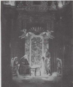
Il-presepu li sar għall-ewwel darba fil-Bażilika.