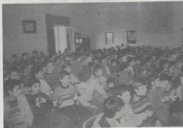
It-tfal waqt il-party.