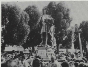
L-Istatwa ta' San Ġorġ ġewwa St. Albans waqt il-purċissjoni fil-festa tas-sena l-oħra.

Għal din il-festa jattendu dejjem folol kbar u aħna nawguraw lil "THE GEORGIANS" suċċess għal festa li ser jorganizzaw. F'dawk il-granet tal-festa aħna żgur ser inkunu magħqudin magħhom fil-ħsieb u l-imħabba li għandna lejn il-patrun tagħna SAN ĠORĠ MARTRI.