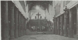
In-nava ċentrali tal-Bażilika ta' Betlem. Ta nteress speċjali huma l-kolonni.

Bniedem ieħor li ta tagħrif dwar fejn twieled Gesù huwa l-Għaref Origene . Dan Origene twieled go Alessandria fis-sena 185 u fis-sena 216 mar jgħix fil-Palestina. Origene jikteb: "Go Betlehem wiehed jgħu muri l-Għar fejn HU (Gesù) twieled, kif ukoll il-mactura fejn