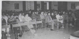
Iż-żgħażagħ attenti jismgħu taħdita