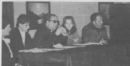
Il-panel li mexxa d-diskussjoni waqt il-play forum

Mis-16 sal-21 ta' Frar li għadda nżammiet fil-parroċċa tagħna il-Ġimgha taż-Żgħażagħ. Grupp ta' mađwar mija u erbgħin żgħażagħ attenda regolarment għall-laqgħat li saru fis-sala taċ-ċentru parrokkjali. Saru taħdidiet minn Mons Isqof (Ara paġna 7), minn Dun Effie Masini, miss-Sur Joe Sammut tal-Caritas Malta, slide feature mill-