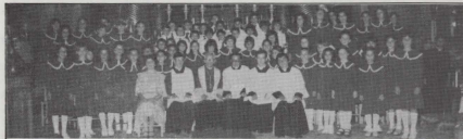
Ritratt juri lill-Kor Laudate Pueri fl-ewwel dehra tiegħu fil-Bażilika ta' San Gorg' Meju 1976.

Chief Justice (Retd.) Prof. J. J. CREMONA, 27/V/86