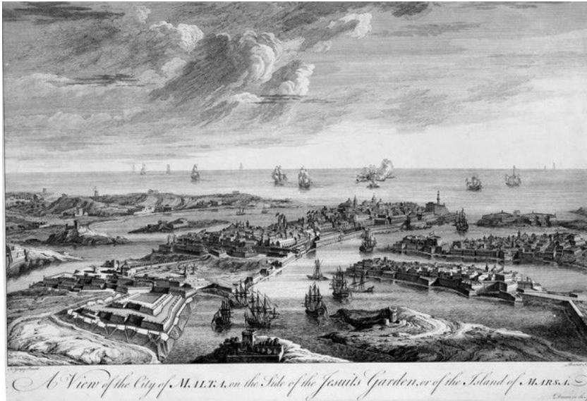
Incizjoni antika li turi l-kunvent u l-knisja tal-Kapuċċini fil-Furjana bhala parti mill-fitt bini li kien hemm f' din il-lokalità.

l-ingenier Malti ta' hila kien iddisinja. 35 Minkejja dan, il-kunvent u l-knisja tal-Kapuċċini fil-Furjana ma setghux ikunu inkluzi f'din il-lista minhabba li kienu għadhom mhumiex mibnija.