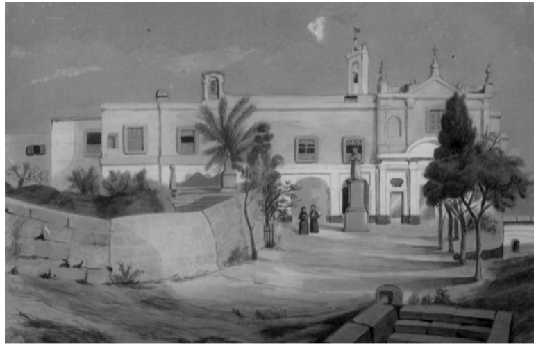
Pittura antika li turi kif kien il-bini tal-knisja u l-kunvent tal-Kapuċċini l-antiki

Fir-rigward tal-kitba ta' dal Pozzo, Patri