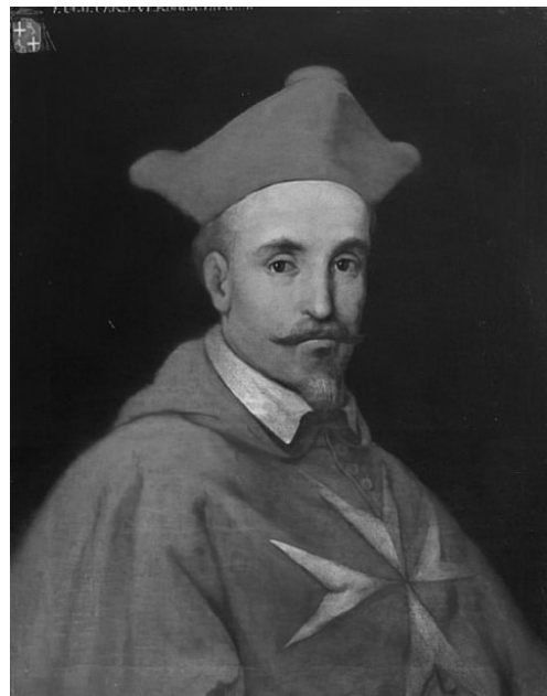
Il-Gran Mastru Verdalle

Patri Pelaġju. F'dan l-istess manuskritt, il-patri Kapuċċin jinkludi inventarju li fih elenka dak li kien hemm fil-knisja u l-kunvent tal-Kapuċċini tal-Furjana fis-sena 1766. Fil-bidu ta' dan l-inventarju, Patri Pelaġju jagħti deskrizzjoni tal-arkitettura tal-knisja tal-Kapuċċini tal-Furjana filwaqt li jerga' jsemmi lil Ġilormu Cassar bhala dak li ddisinja dan il-bini pjuttost umli mingħajr ebda ammirazzjoni ta' arti. “Pjanta u disinn tal-knisja flimkien ma' dik tal-kunvent magħmula mill-inginier magħruf Malti, Ġilormu Cassar, imwaqqfa mill-Emminentissimu Sinjur Kardinal u Gran Mastru, Fra Ugo de Lobaux de Verdala.” 7 Hawnhekk iżda, Patri Pelaġju jerga' ma jgħidx liema kien l-għejun storiċi li fuqu kien qed jistrieħ fir-rigward ta' din l-informazzjoni storika dwar Ġilormu Cassar bhala l-arkitett tal-knisja u l-kunvent tal-Kapuċċini.