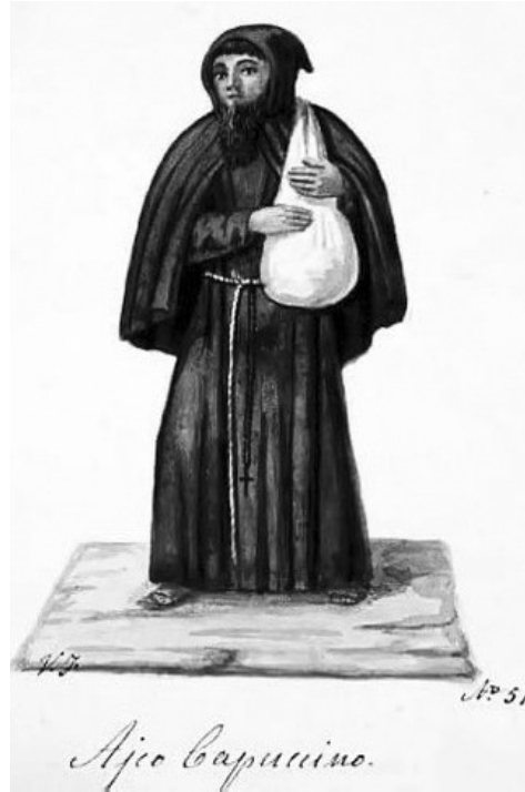
Stampa antika ta’ Patri Kapuċċin bil-ħorġa taċ-ċirka