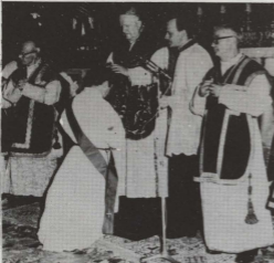
Il-Kardinal Florit waqt il-funzjoni tal-Ordni Sagramentali fil-Bażilika ta' San Ġorġ

Nhar il-Hadd, 8 ta' Diċembru 1985 thabbret il-mewt tal-Eminenza Tiegħu l-Kardinal Ermenegildo Florit ta' Firenze. Huwa kellu 84 sena.