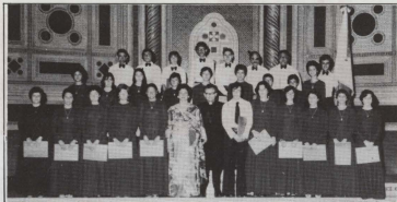
IL-CHORUS URBANUS jidher mas-Sejda Papali fl-Arcibazilika tal-Lateran f'Ruma wara li ha sehem fil-koncelebrazzjoni ta' nhar Santa Marija - 15 ta' Awissu 1977.

Propju fil-Lejl tal-Milied waqt il-quddiesa ta' Nofs il-Lejl il-Chorus Urbanus tal-Bazilika ta' San Gorgj iccelebra eghluq l-għaxar anniversarju mit-twaqqif ufficjalji tiegħu. Bhala tifkira ta' dan l-avveniment saret bibita wara l-quddiesa ta' nofs il-lejl li għaliha kien mistieden il-Kleru tal-Bazilika.