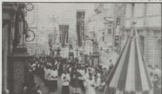
Il-Kapitu u l-Kleru Ġorġjan jidher jimmarrċja fil-Proċessjoni li saret bir-Relikwija fi Triq ir-Repubblika nhar il-Mamis 12 ta' Lulju. Fil-proċessjoni hadet sehem ukoll il-Banda La Stella.