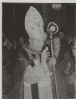
L-Eminenza Tiegħu l-Kardinal Corrado Ursi li mexxa l-funzjonijiet ewlenin li saru fil-Bażilika bejn l-11 u l-12 ta' Lulju.