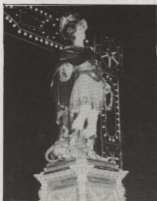
L-istatwa artistika ta' San Ġorġ, imdawwra mat-toroq u l-pjazze ewlenin ta' belma f'Jum il-Festa.