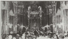
Dehra generali tal-Bażilika waqt l-Akkademja li saret taht il-harsien tal-Kardinal Rossi.