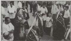
Il-Sibt - Lejlet il-Festa - Transulazzjoni Sollenni bir-Relikwija ta' San Ġorġ trasportata mill-Kardinal Rossi.