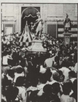
Falal kbar ta' nies hanqu Misrah San Ġorġ f'Jum il-Festa biex jassistu għall-fruh tal-Proċessjoni Sollejni.