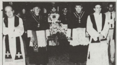
Fil-proċessjoni ta' din is-sena nġarret għall-ewwel darba r-Relikwiġa (tal-Velabro). Fir-ritratt tidher qed tiġi merfugħha fuq l-idejn minn erba' Kanonici tal-Kollegġjata.