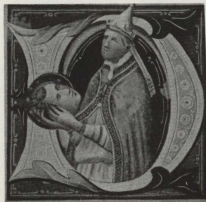
Tranzizzjoni ta' Ras il-Martiri San Ġorġ mill-Patrijarkat Lateranensi għad-Dioknes tal-Velator mill-Papa San Żakkarija.

Għaddew mijiet ta' snin u l-ewwel persekuzzjonijiet li hakmu l-Knisja ta' Kristu għadhom min-naha l-wahda jdallmu l-istorja tad-dinja u jnisslu fil-bnedmin sentimenti ta' tkexxir u ta' protesta umana u, min-naha l-oħra, idawlu l-istorja tal-Knisja u jnisslu fil-qlub ta' l-insara sentimenti ta' kburiya nisranija u tama tas-Sema.