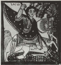
SAN ĠORĠ TAL-ETJOPJA Gogjian Amhara

Bi thejjiġa għal ċelebrazzjoni dejjem aktar awtentika tal-Festi Centinarji ta' San Ġorġ, qed nippublikaw l-ewwel fost sensjela qasira ta' riflessjonijiet dwar dan il-qaddis martri li b'mod ta' l-għoġeb għied lejha l-ammirazzjoni u l-qima ta' kotra bla għadd ta' nsara tul dawn l-aħħar elf u seba' mitt sena. Kitba ta' Fr. Joseph Farrugia.