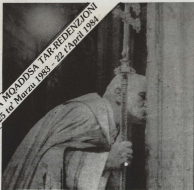
Il-Papa Gwann Pawlu II jidher ibus il-"Porta Santa" tal-Bażilika ta' San Pietru fil-ftuh tas-Sena Mqaddsa.

SENA MQADDSA TAR-REDENZJONI 25 ta' Marzu 1983 - 22 t'April 1984