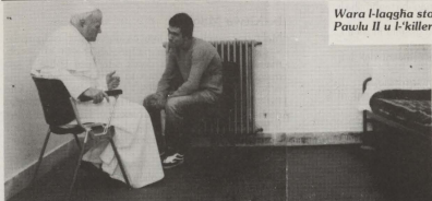
Wara l-laqgħa storika bejn il-Q.T. il-Papa Ġwanni Pawlu II u l-'killer' Ali Agca.