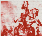
Statwa fl-injam c 1400 (Chiesa Parr. S. Giorgio) Castelmola, Messina, Sicilia.

Il-kommemorazzjoni ċentinarja tat-twelid ta' San Ġorġ, imqanqla mir-Rettur tal-Bażilika Romana tal-Velabro u minn għadd ta' studjużi, joffrulna motiv — matul is-sena Gubilar tal-Fidwa — biex nidhlu f'riflessjonijiet ta' karattru