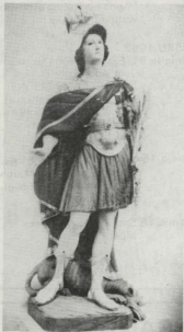
San Ġorġ: qaddis u suldat nobbli ta' Kristu.