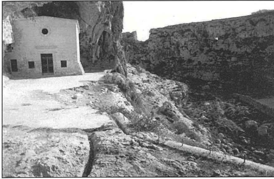
Il-kappella ta' San Pawl Eremita – aktar mill-qrib.