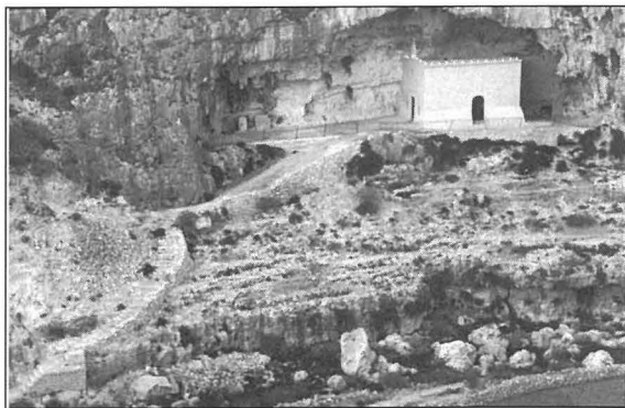
Il-kappella ta' San Pawl Eremita f'ghar f'Wied il-Ghasel, fejn hu maħsub li kien jghix San Kurradu.

Ġewwa għar f'Wied il-Ghasel. qrib il-kappella ta' San Pawl Eremita, kien jghix raheb twajjeb. Minn hdejn dan il-ghar kienu jghaddu xi bdiewa li kellhom l-għelieqi tagħhom fil-qrib. Minn kliemhom u għemilhom kienu