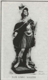
SAN ĠORGĠ MARTRI