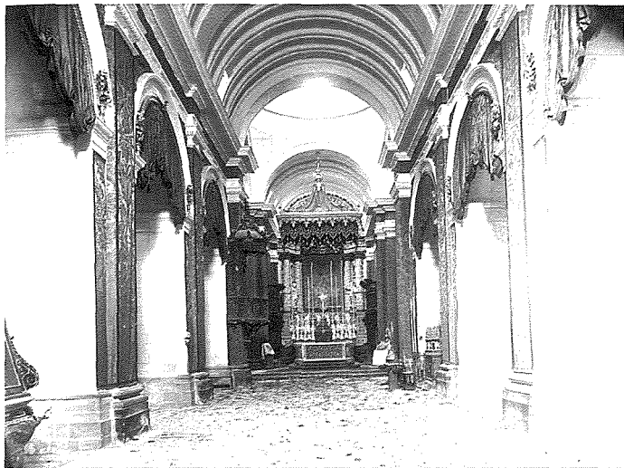
Il-knisja minn ġewwa fil-bidu tas-seklu għoxrin