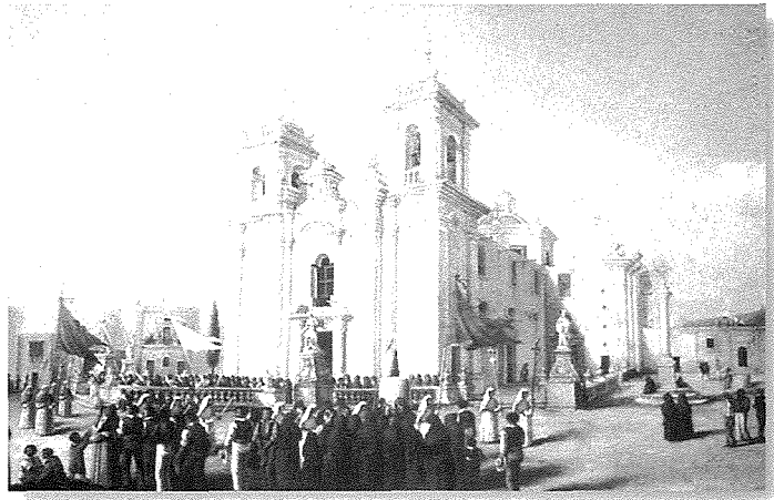
Il-Knisja lejn l-aħħar tas-seklu dsatax.

Meta ġew il-kavallieri ta' San Ġwann f'Malta fl-1530, il-ħajja tal-Maltin fl-irhula antiki tagħhom kompliet għaddejjja kif kienet. Mhux talli hekk, l-Ordni ta' San Ġwann bir-riżorsi li kellu kompli jhegġeġ u jisfrutta r-riżorsi tal-Maltin f'kull qasam, ukoll fit-talenti tagħhom. Il-ġebli u l-ħila tal-Maltin kienu hawn, kull ma kien jonqos kienu l-flus.