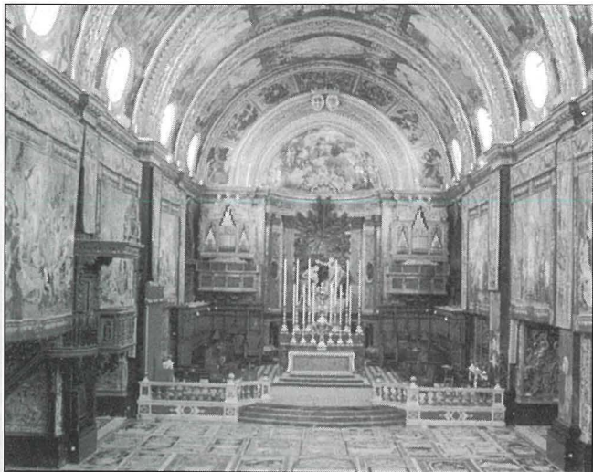
Din il-binja barokka, imżejna bl-arazzi famużi, issaħħar lil kull viżitatur li jixref mill-bieb 'il ġewwa ta' dan it-tempju. "Din hi l-aktar knisja meraviljuża li qatt rajt f'hajti" - hekk kien stqarr Sir Walter Scott, meta gie Malta fl-1831 u żar il-Kon-Katidral ta' San Ġwann. (kartolina pubbliċitarja)

Qabel is-serqa l-kbira ta' Napuljun fl-1798, il-Kappelli tal-Lingwi kellhom ferm iżjed relikwi u ornamenti mahdumin minn deheb, fidda u haġar mill-ifjen. Ftit jiem wara li Napuljun Bonaparti hataf dawn il-gżejjer, hareġ ordni fit-13 ta' Ġunju 1798 li fiha għarraf lill-General Berthier: "Għandek taghti l-amar liċ-ċittadini Monge u Berthollet li jaghmlu żjara tal-Flus u tat-Teżor lill-Knisja ta' San Ġwann u ta' imkejjen ohra fejn jista' jkun hemm hwejjeġ prezzjużi". Art. 1. "Iċ-