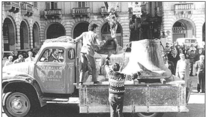
Haddiema tal-Kumpanija Vassallo Builders tal-Mosta qegħdin jgħabbu l-qanpiena l-kbira fuq trakk, hekk kif ġiet żarmata mill-kampnar biex seta' jsir ir-restawr meħtieġ fl-1989.

Ġiet riservata hafna mill-gebla originali. Inbidel biss fejn id-deterjorazzjoni laħqet livelli li l-hsara kienet impossibbli li tiġi rkuprata. Għal aktar minn sena, il-haddiema li whud minnhom kienu Mostin, wettqu xogħol fuq il-kampnari, il-faċċata u fuq is-soqfa ta' l-Oratorju u tal-Kon-Katidral. Inghata l-membrejtn fuq il-kampnari u kull fejn kien meħtieġ, biex jiġi assigurat li dan it-tempju jiġi mħares mill-perikli li jikkagunaw l-ilma tax-xita. Fil-blokk amministrattiv li jagħmel parti mill-kumpless ta' San Ġwann, sar xogħol fuq bibien u twieqi ġodda u nġatatt atenzjoni fuq is-sistema ta' sigurtà.