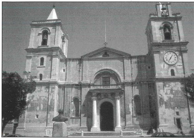
Il-Kon-Katidral ta' San Ġwann hu monument kolossali li jiġbor fih xoghlijiet ta' l-għażeb. Hu l-akbar entità artistika ta' importanza strateġika li tinsab fil-Belt Kapitali taghna. (kartolina pubbliċitarja)

Madonna bil-Bambin, aktar maghrufa bhala "Ta' Carafa".