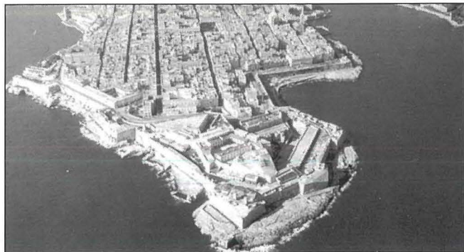
M'hemm l-ebda belt oħra fil-Mediterran li toffri għadd kbir ta' l-inħawi u postijiet ta' interess li jinsabu mifruxa fuq biċċa art ċkejna fid-daqs, bħalma hi l-Belt Valletta.

Diversi kwadri ta' qaddisin u monumenti għall-unur tal-Gran Mastri, fost oħrajn, huma l-qofol artistiku li nilmhu f'kull kappella. Barra minn dan, nosservaw għadd ta' oġġetti ta' preġju bħal ngħidu ahna, salib Bizantin miġjub minn Rodi u xogħol tal-fidda li juri l-