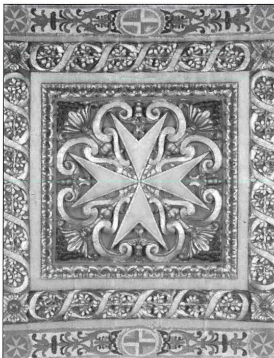
Għal mijiet ta' snin, is-Salib tat-tmien Ponot, kien ifisser is-simbolu ta' ħakma fuq dawn il-gżejjer. Il-Kon-Katidral hu mqassam fi tmien kappelli, waħda għal kull lingwa li jsensu s-Salib ta' l-Ordni. (kartolina pubbliċitarja)

Fl-1836, il-Gvern Inġliż kien qabbad lill-artist Malti Gużè Hyzler biex jagħmel tibdila radikali fid-dekorazzjoni li ssawwar din il-kappella. Oriġinarjament meta kienet saret l-iskultura fi żmien il-Gran Mastru Alof de Wignacourt fl-1624, il-pilastru ta' madwar l-altar