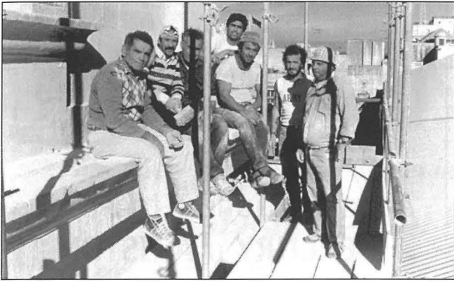
Il-bennejja li hadmu fuq il-proġett ta' restawr li sar fuq il-bini tal-Kon-Katidral mill-Kumpanija Vassallo Builders, fejn xi whud minnhom huma Mostin.