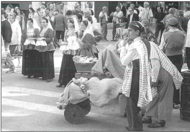
Bosta bdiewa Mostin u l-familji tagħhom, imħarrġin ukoll fis-sengħa tal-bini, taw is-sehem tagħhom fil-qasam ta' l-infrastruttura biex setgħu jinbnew diversi binjiet importanti li sawwru u sebbħu l-Belt Umillissima.

(Valletta History and Elegance - 2000 / ritratt: Louis Vassallo)